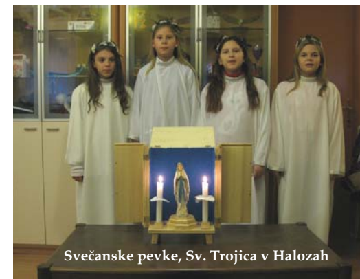
Svečanske pevke, Sv. Trojica v Halozah